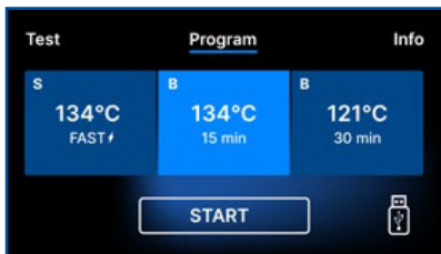
Écran EcoSteam FBS