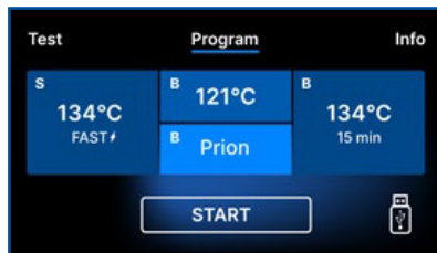
Écran EcoSteam BFL