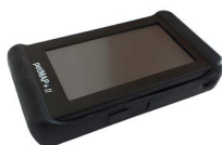
Housse de protection