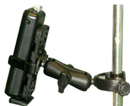
Support pied à perfusion