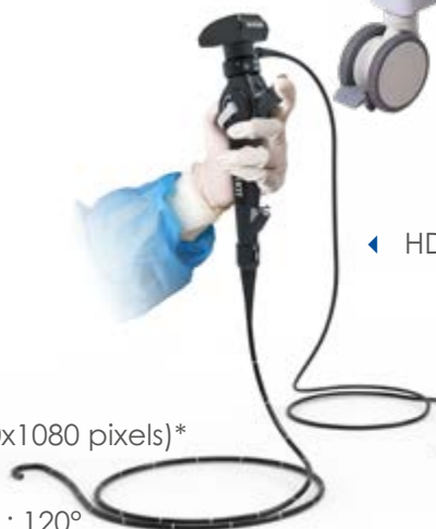
◀ HDScope USB